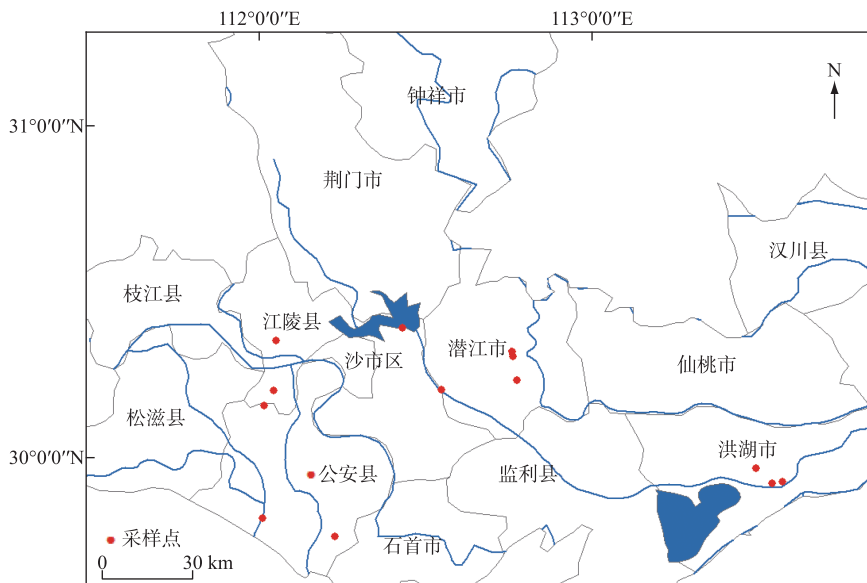
图 1 采样点分布

通过采用入户访谈的方式获取了稻虾轮作模式生产的基本情况:包括种植/养殖面积、生产模式;生产投入情况:稻种、虾苗、肥料、地笼和防逃设施、饲料、机耕/机收、雇工、水电等;产出:水稻产量和小龙虾产量;换水和补水方式、水量、时间和周期等。调研结果显示:各采样点农户采用自繁虾苗或自繁虾苗+补苗的方式养殖,主要靠经验进行田间水肥管理和投饲,投放饲料均为虾蟹专用料,小龙虾产量为 1000~2700 kg/hm 2 (表 1)。养殖水体主要来源于附近河道或沟渠,养殖期间基本不换水,仅进行补水,小龙虾养殖结束水稻种植前将稻田的田面水基本排干,直接排入附近河道或沟渠。