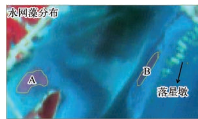
图3 鄱阳湖水网藻水华空间分布 (A 和 B 为水网藻水华主要分布区域)