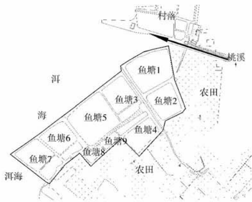
图1 桃溪河口工程区鱼塘分布图

桃溪入湖口北侧现有9个鱼塘,平均水深3m,总面积约55000 m 2 .由于这9个鱼塘均在洱海湖滨带保护范围内,2002年3月实施退塘还湖后,该9个鱼塘均废弃.为防农民再度养鱼,每个鱼塘均开了6 m宽的缺口,与洱海连通(图1).