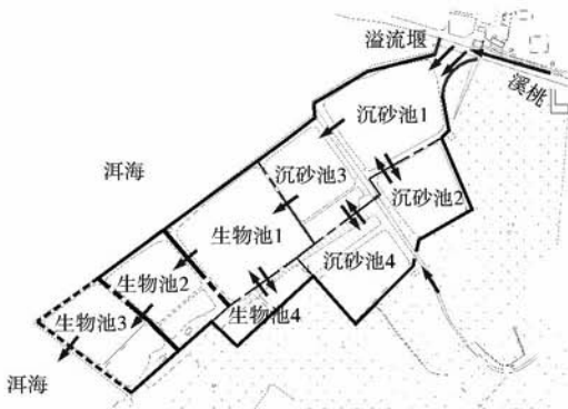
图3 桃溪河口净化工程平面布置图(虚线为塘埂开口)

工程进水系统包括溢流堰和导流墙。溢流堰设置在桃溪入湖口处,导流墙为弧形,其目的是引导河水顺畅进入净化系统(图3)。