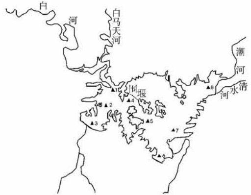
图1 密云水库采样断面分布图

会稳定. 二十世纪八十年代以来对密云水库的水质已有陆续报道 [1-4] , 但均把其作为一整体. 实际上在密云水库的库东(4号断面)与金沟(5号断面)之间有一条人工建造的围堰, 把此库分为东、西两个库区, 围堰上只有两个人工挖开的几米宽的缺口. 由于1999年以来华北地区的连续干旱, 库区蓄水量锐减, 2001-2003年的蓄水量分别仅有 14.03 \times 10^8 \text{ m}^3 , 12.09 \times 10^8 \text{ m}^3 , 8.15 \times 10^8 \text{ m}^3 , 水位急剧下降. 两库区水体仅能通过围堰缺口进行交换. 2002年我们在库区8个断面均测不出流速, 两库区水体基本稳定, 交换率很低. 西库区的人库河流主要是白河, 其次为白马关河、对家河. 东库区主要入库河流是潮河, 其它还有清水河、安达木河、放马峪河、牯牛河. 5年多的连续干旱, 除白河、潮河有少量水入库外, 其它河流基本处于干涸状态, 只有每年的汛期偶有大雨时才有少量浑水进入河道. 所以西库区水质主要决定于白河, 东库区主要决定于潮河. 为探讨密云水库东、西库区水质差异, 作者于2001-2002年对两库区的理化性状与浮游藻类进行了调研, 以期为有效地防治密云水库富营养化提供科学依据.