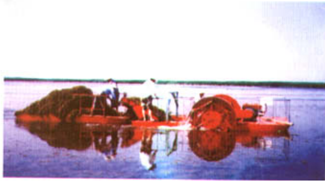
图 2 9GSCC - 1.4H 型水草收割机船

内蒙古农业大学于 1990 年研制成功 9GSCC - 1.4H 型水草收割机船(图 2), 该水草收割机船为我国草型湖泊生态恢复提供了一项实用的机械化技术手段, 大规模收割水生植物可以有效地转移氮、磷营养盐, 削弱草型湖泊内源性营养物负荷的积累, 抑制生物促淤作用。这项技术在对草型湖泊进行治理的过程中还可以收获大量高蛋白水草饲料, 是湖泊生态治理与水生植物资源开发利用兼顾的一个技术典型。